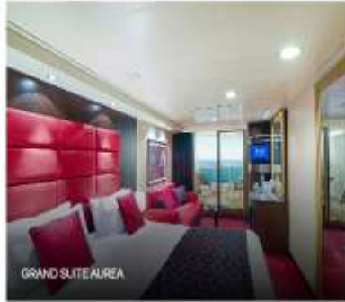
GRAND SUITE AIREA