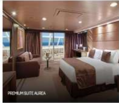
PREMIUM SUITE AIREA