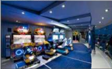
VIDEO GAMES ARCADE