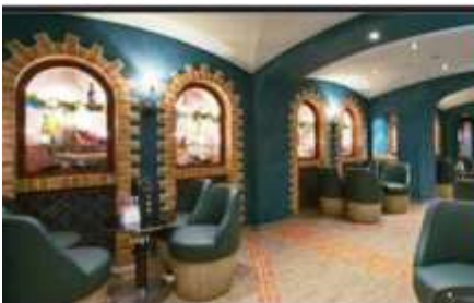
LA CANTINA DI BACCO