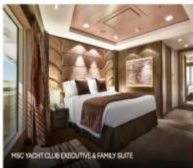
MSC YACHT CLUB EXECUTIVE & FAMILY SUITE