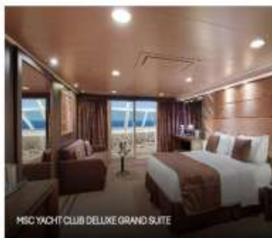
MSC YACHT CLUB DELUXE GRAND SUITE