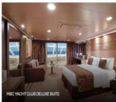
MSC YACHT CLUB DELUXE SUITE