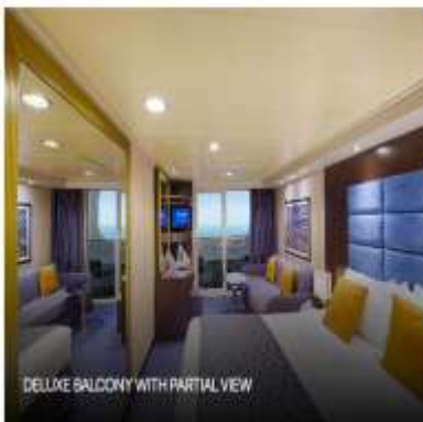
DELUXE BALCONY WITH PARTIAL VIEW