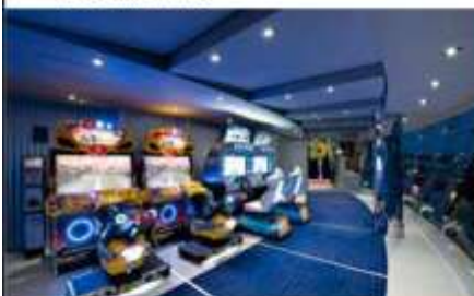
VIDEO GAMES ARCADE