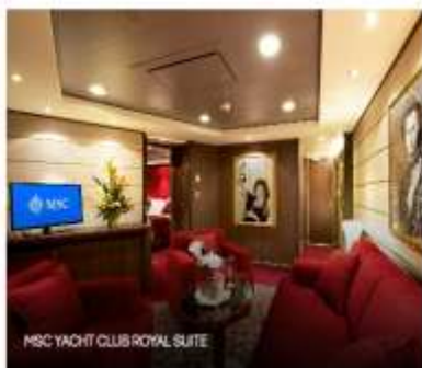
MSC YACHT CLUB ROYAL SUITE