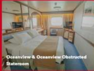
Oceanview & Oceanview Obstructed Stateroom