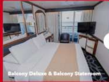
Balcony Deluxe & Balcony Stateroom