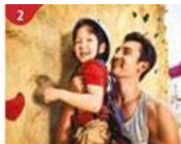
2 Rock Climbing Wall Challenge yourself on our mountainous rock climbing wall.