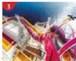
3 Waterslide Park Get drenched in fun on one of our six different waterslides.