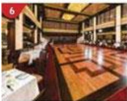
6 Dream Dining Room Savour a wide variety of Asian and international cuisine.