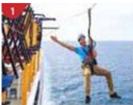
1 Ropes Course & Zipline Feel the thrill of gliding above the ocean on a 35-metre zipline.