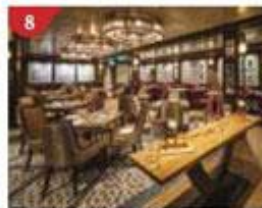
8 Bistro By Mark Best Relish contemporary Western cuisine from the internationally-acclaimed Australian chef.