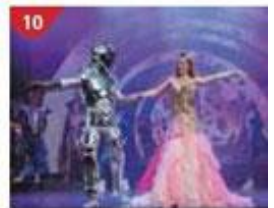
10 Zodiac Theatre Enjoy live production shows from the acclaimed award-winning entertainment team.