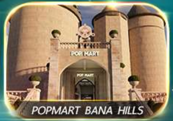
POPMART BANA HILLS

สัมผัสความงามหมู่บ้านฝรั่งเศสที่บานาฮิลล์ ซ้อปปิ้ง POPMART