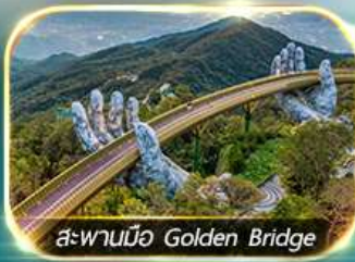
สะพานมือ Golden Bridge