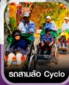
รถสามล้อ Cyclo