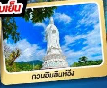
กวนอิมลินห์ฮิ่ง