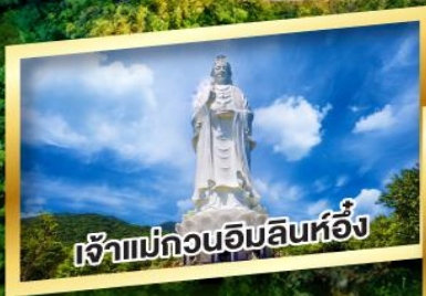
เจ้าแม่กวนอิมสินห์อั้ง