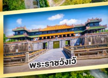
พระราชวังเว็