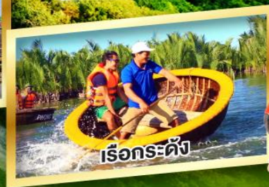
เรือกระดั่ง