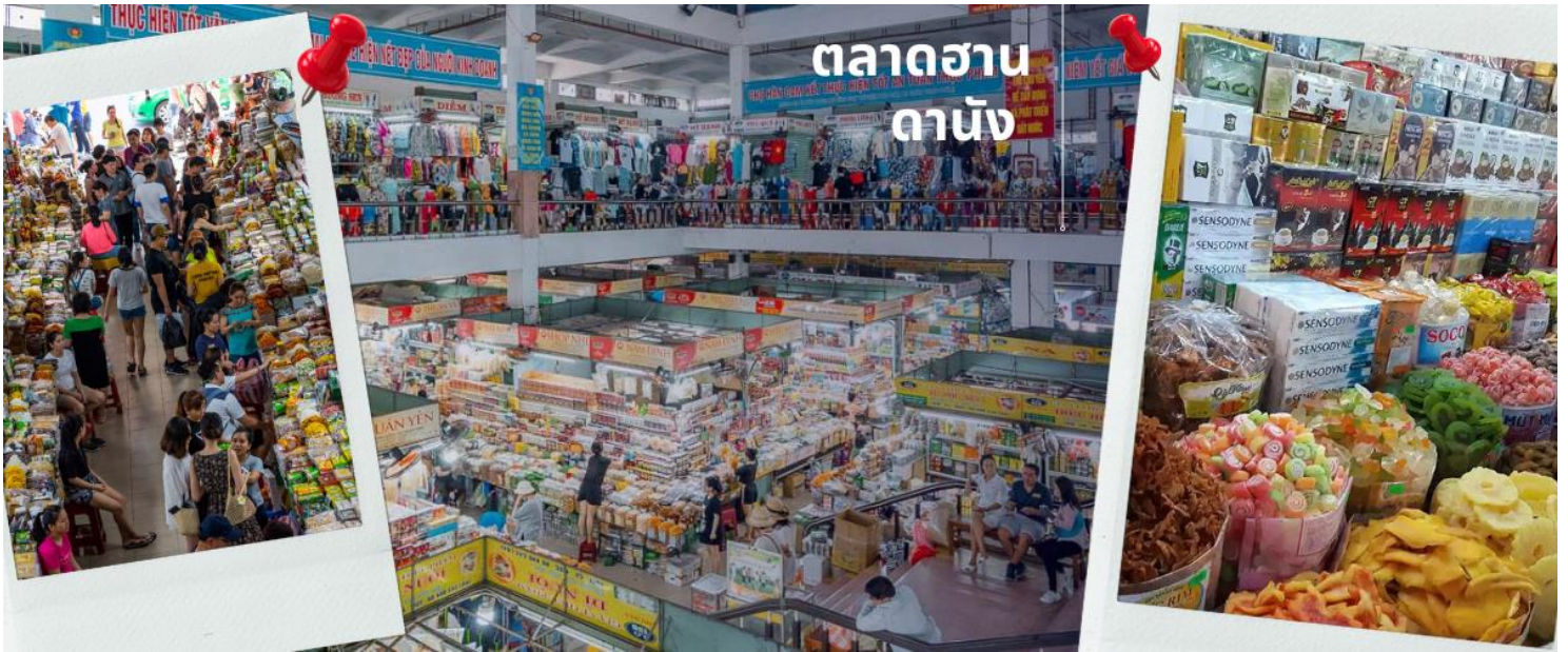
ตลาดฮาน ดานัง

นำท่านไปละลายทรัพย์ที่ ตลาดฮาน เป็นตลาดที่รวบรวมสินค้ามากมายเป็นที่นิยมทั้งชาวเวียดนามและชาวไทย อาทิ เสื้อเวียดนาม หมวก รองเท้า กระเป๋า สินค้าพื้นเมือง โดยเฉพาะงานฝีมือ อาทิ ภาพผ้าปักมืออันวิจิตร คอมพิวเตอร์ ผ้าปัก กระเป๋าปัก ตะเกียบไม้แกะสลัก ชุดอ่าวหาย่าย(ชุดประจำชาติเวียดนาม) ไว้เป็นที่ระลึกมากมายเพื่อฝากคนที่บ้าน