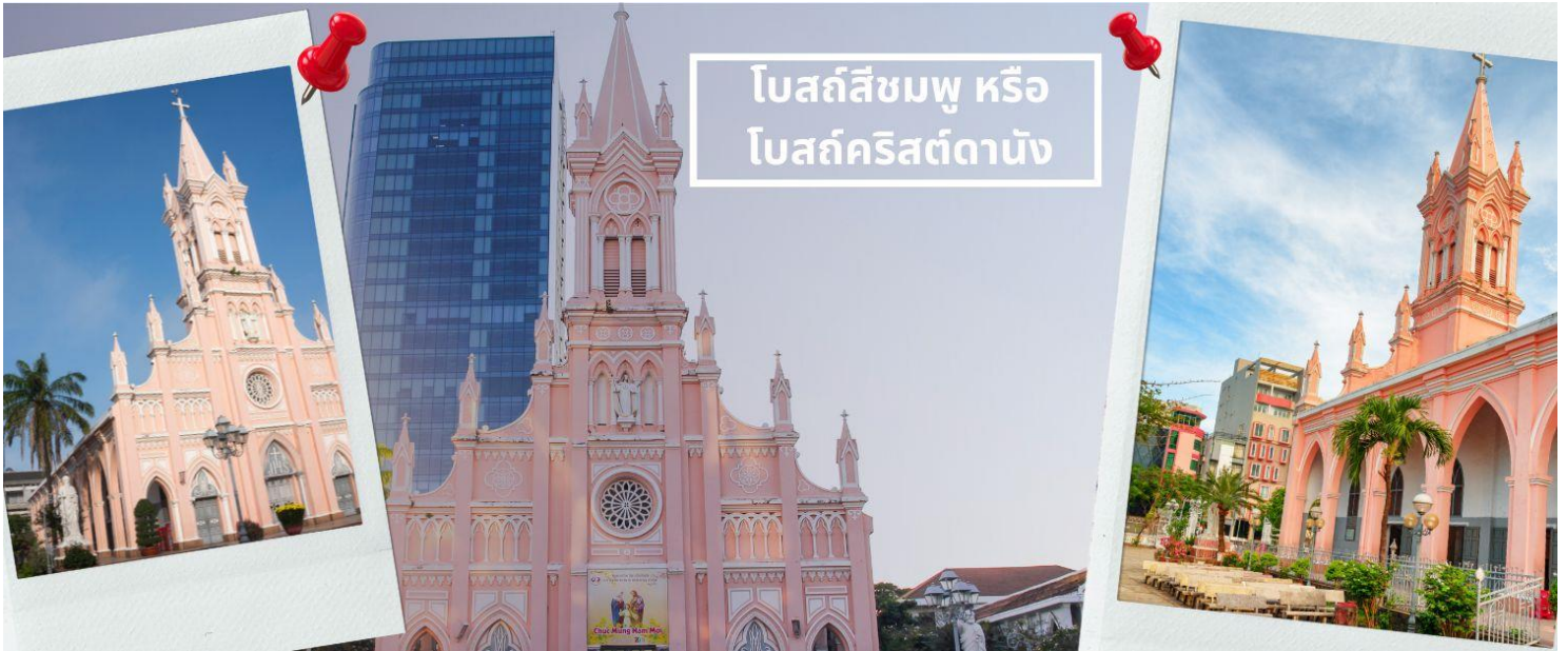
โบสถ์สีชมพู หรือ โบสถ์คริสต์ดานัง

นำท่านไปละลายทรัพย์ที่ ตลาดฮาน เป็นตลาดที่รวบรวมสินค้ามากมายเป็นที่นิยมทั้งชาวเวียดนามและชาวไทย อาทิ เสื้อเวียดนาม หมวก รองเท้า กระเป๋า สินค้าพื้นเมือง โดยเฉพาะงานฝีมือ อาทิ ภาพผ้าปักมืออันวิจิตร คอมพิวเตอร์ ผ้าปัก กระเป๋าปัก ตะเกียบไม้แกะสลัก ชุดอ่าวหาย่าย(ชุดประจำชาติเวียดนาม) ไว้เป็นที่ระลึกมากมายเพื่อฝากคนที่บ้าน