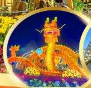
สะพานมังกรพ่นไฟ