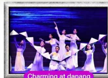
Charming at danang