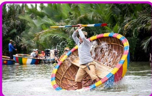
พิเศษ !!! นั่งเรือกระดัง UNSEEN เวียดนาม