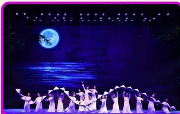
ชมการแสดง Charming Show Danang