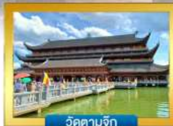
วัดตามจิก