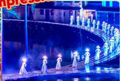
Hoi An Impression Show