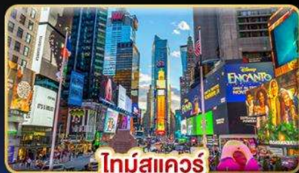
ไทม์สแควร์