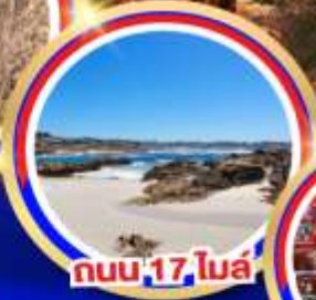
ถนน 17 ไมล์