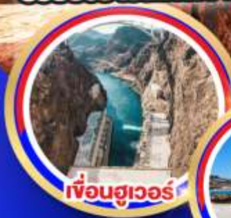
เฟือนฮูเวอร์

ช้อปปีงจูใจเอี๊ยทลีตออนตารีโอมิลล์ ช้อปปีงบาร์ทสไควเอี๊ยทลีต