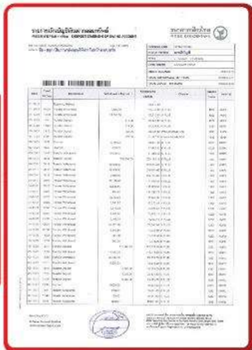
ตัวอย่าง Bank Statement ที่ผู้สมัครต้องยื่นมา