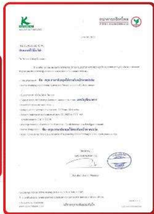
ตัวอย่าง Bank Guarantee ที่ผู้สมัครต้องยื่นมา