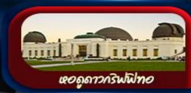
หอดูดาวกริฟฟิท

การันตี 10 ท่านออกเดินทาง พร้อมหัวหน้าทัวร์คนไทย