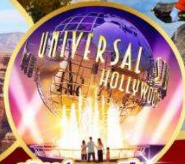
ยูนิเวอร์แซลสตูดิโอ