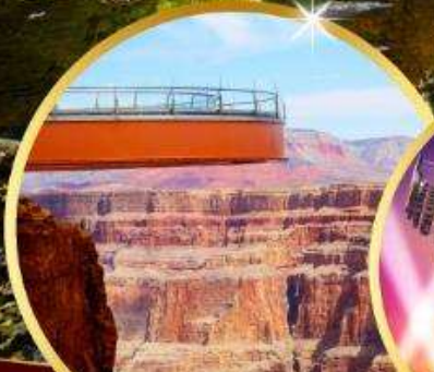
แกรนด์แคนยอน Sky walk