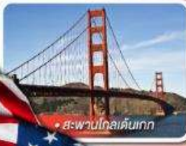
สะพานโกลเด้นเกต