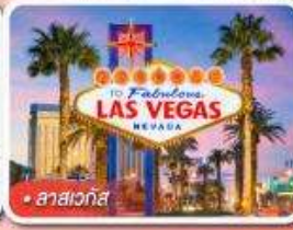
ลาสเวกัส