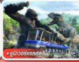
ยูนิเวอร์แซลสตูดิโอ