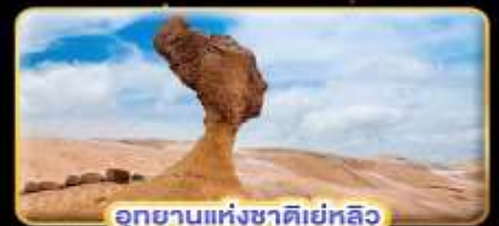
อุทยานแห่งชาติเย่หลิว