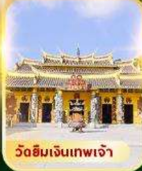
วัดซีเมจินเทพเจ้า