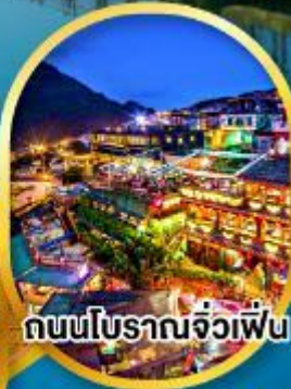
ถนนโบราณจิวเฟิน