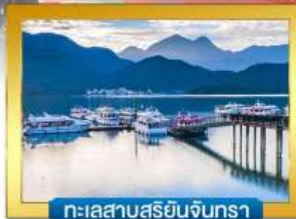
ทะเลสาบสุริยอันจินตรา