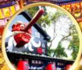
หมู่บ้านปี่สางชิวโกว