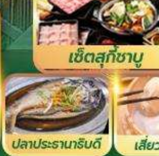
ปลาประรานาธิบดี