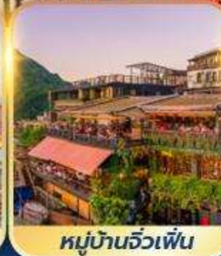
หมู่บ้านจิวเฟิ่น