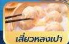
เสี่ยวหลงเป่า