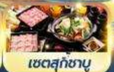
เซตสุกชาบู