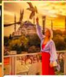
ลู่ฟกือปเซเวนฮิลล์ส