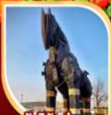
น้ำไม้แห่งทรอย