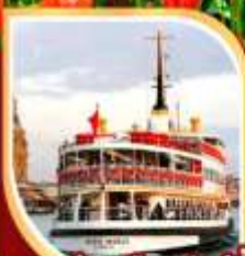
ล่องเรือเฟอร์รี่