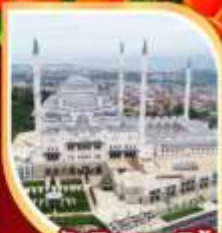
มัสยิดคามลิกา