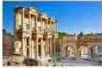
เมืองโบราณเอเฟซุส