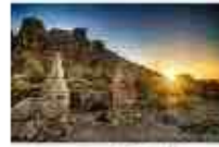
ชมพระอาทิตย์ขึ้น