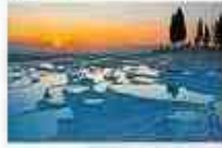
ปามุคคาเล่

** ที่พัก RICHMOND THERMAL HOTEL 5* หรือเทียบเท่า **