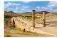
สะพานเซเวอรัม

19.20 น. เห็นฟ้าสูนครอิสตันบูล โดยเที่ยวบิน TK 2215