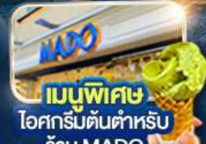
เมนูพิเศษ ไอศกรีมต้นตำหรับ ร้าน MADO