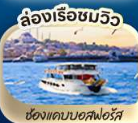
ล่องเรือชมวิว ช่องแคบบอสฟอรัส