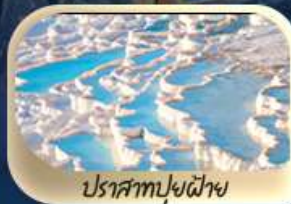
ปราสาทปูนสีขาว