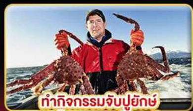
ทำกิจกรรมจับปูยักษ์ “พร้อมเมนูสุดพิเศษ”