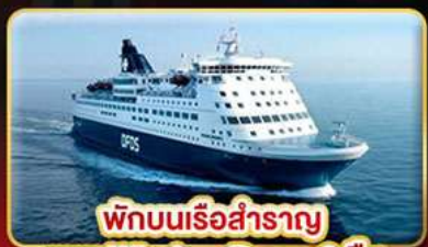
พักผ่อนเรือสำราญ แบบ Window Room 2 คืน