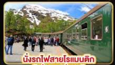
นั่งรถไฟสายโรแมนติก “ฟรอมสปาน่า”