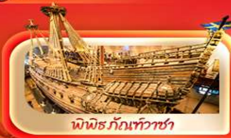
พิพิธภัณฑ์ท้าวชา