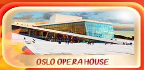
OSLO OPERA HOUSE