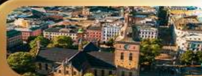
มหาวิหารออสโล