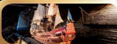
พิพิธภัณฑ์วาทาซา