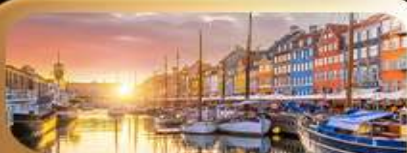
ท่าเรือสต็อกโฮล์ม