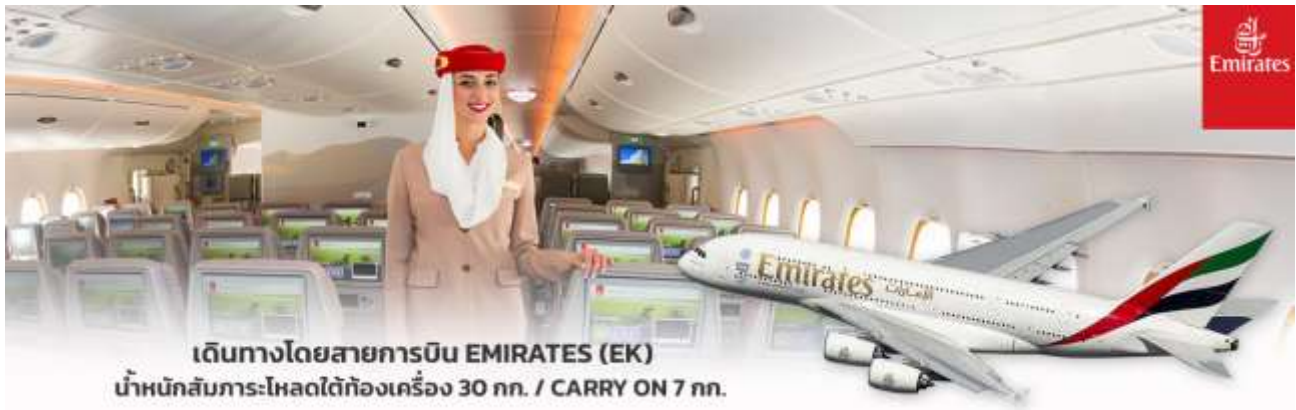
เดินทางโดยสายการบิน EMIRATES (EK) นำหนักสัมภาระ:โหลดใต้ท้องเครื่อง 30 กก. / CARRY ON 7 กก.