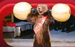
ชมละครสัตว์