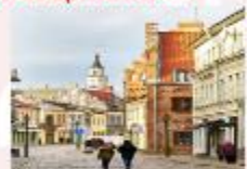
Kaunas Old Town

** พักที่ Holiday Inn Vilnius Hotel 4* หรือเทียบเท่า **