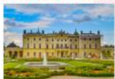
พระราชวัง Branicki