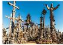
Hill of Crosses