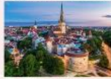
Tallinn Old Town