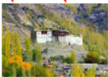
บ้อมบัลดิท