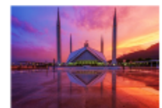
มัสยิดไฟซาล

19.30 น. นำท่านเดินทางสู่สนามบินอิสลามาบัด 23.20 น. ออกเดินทางสู่กรุงเทพ เที่ยวบิน TG350