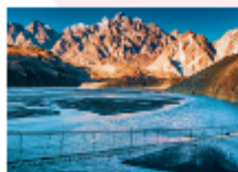
สะพานแขวนอุสโซนิ