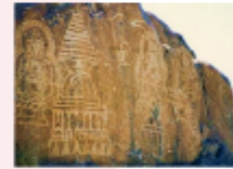
เมืองซีลาส

** พักที่ Shangrila Chilas Hotel หรือเทียบเท่า **