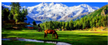
แฟร์มีโควส์