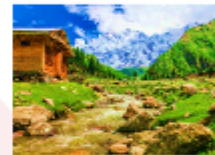
ยอดเขานังกาพาร์บัต

** พักที่ Raikot Sarai Hotel หรือเทียบเท่า **