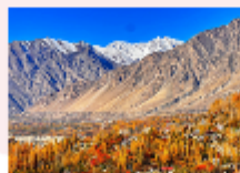
หุบเขาพาสสุ

** พักที่ Sarai Silk Route Hotel หรือเทียบเท่า **