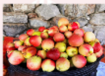
สวนผลไม้ตามฤดูกาล

** พักที่ Duiker Hard Rock Hotel หรือเทียบเท่า **