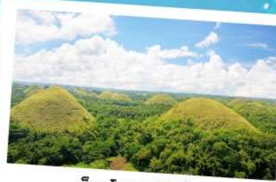
ช็อคโกแลตฮิลล์