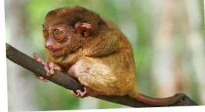
ลิงทาร์เซียร์