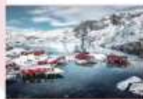
หมู่บ้าน Nusfjord

** พักที่ ELIASSEN RORBUER OR SIMILAR **