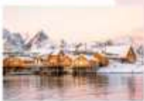
หมู่บ้าน Sakrisoy