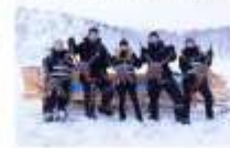
สนุกกับกิจกรรมจับปูยักษ์

00.00 น. ออกเดินทางสู่ เมืองคีร์กเคนเนส โดยสายการบิน...เที่ยวบินที่... 00.00 น. เดินทางถึงสนามบินเมืองคีร์กเคนเนส