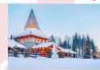
หมู่บ้านซานต้าครอส

15.25 น. ออกเดินทางสู่อิสตันบูล ประเทศตุรกี เที่ยวบินที่ TK 1750