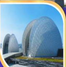
โรงละครหอยโข่งบุก