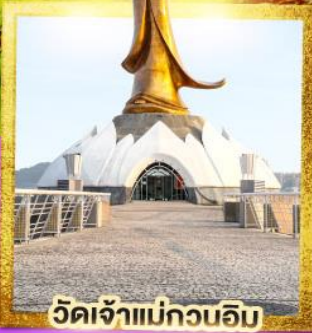
วัดเจ้าแม่กวนอิม