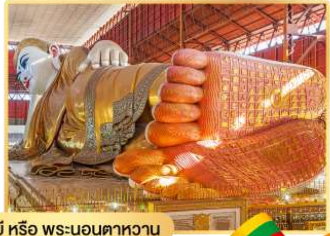
พระพุทธรูปไสยาสน์เจ้ากัศย หรือ พระนอนตาทหวาน

นำท่านสักการะ พระพุทธรูปไสยาสน์เจ้ากัศย (Kyauk Htatgyi Buddha) หรือ พระนอนตาทหวาน นมัสการพระพุทธรูปนอนที่มีความยาว 55 ฟุต สูง 16 ฟุต ซึ่งเป็นพระที่มีความสวยที่สุดมีขนตาที่งดงาม พระบาทมีภาพมงคล 108 ประการ และพระบาทซ้อนกันซึ่งแตกต่างกับศิลปะของไทย