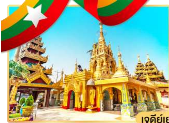
เจดีย์เยเลพญา

จากนั้นนำท่านเดินทางโดยรถโค้ชสู่ เมืองสิริเรียม ซึ่งอยู่ห่างจากกรุงย่างกุ้งประมาณ 45 กิโลเมตร เมื่อเดินทางถึงเมืองสิริเรียม ชมความงามแปลกตา ของเมือง ซึ่งเมืองนี้เคยเป็นเมืองท่าของโปรตุเกสในสมัย