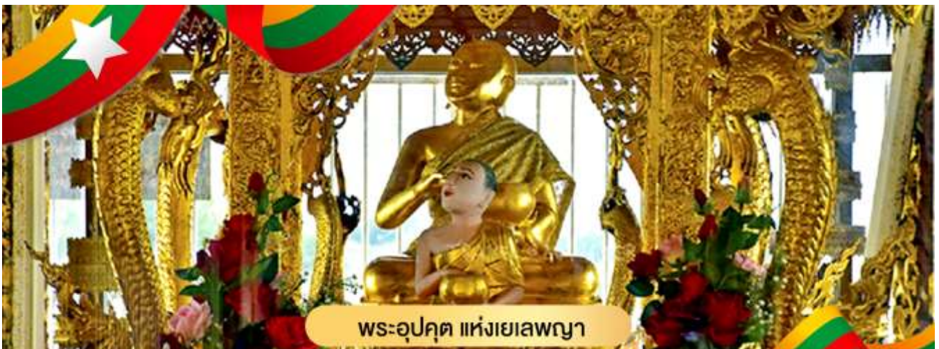
พระอุปคุต แห่งเยเลพญา

นำท่านไหว้สักการะเพื่อขอพร พระจกบาตร หรือพระอุปคุต ที่เป็นที่นับถือของชาวพม่า สามารถซื้ออาหารเลี้ยงปลาตุ๊กตัวใหญ่นับพัน ที่ว่ายวนเวียนให้เห็นครีบหลังที่โผล่เหนือผิวน้ำ