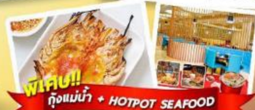
พิเศษ!! ก๊วยแม่น้ำ + HOTPOT SEAFOOD