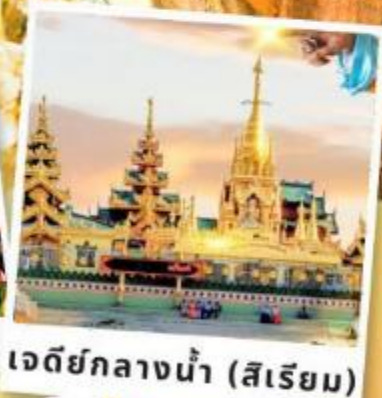
เจดีย์กลางน้ำ (สีเรียม)