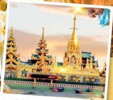
เจดีย์กลางน้ำ (สิเรียม)