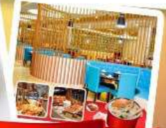
กึ่งแม่น้ำ + HOTPOT SEAFOOD