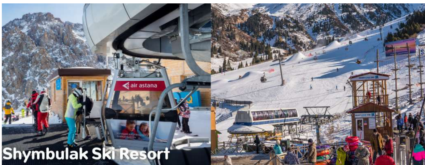
Shymbulak Ski Resort

นำท่านขึ้นกระเช้าสู่ ชิมบุลัก สกีรีสอร์ท สกีรีสอร์ทที่ใหญ่และทันสมัยของอัลมาตี แวดล้อมด้วยเทือกเขาสูงที่ปกคลุมด้วยหิมะขาวโพลนบนยอด ป่าสนอายุหลายร้อยปี และทะเลสาบในหุบเขา ซึ่งท่านสามารถชมทิวทัศน์ที่สวยงามของเมืองจากมุมสูงท่ามกลางสายลมหนาวอันสดชื่น จากสกีรีสอร์ทแห่งนี้ พื้นที่ของรีสอร์ทประกอบด้วยลานสกีและเครื่องเล่นสำหรับกิจกรรมหิมะหลากหลายซึ่งท่านสามารถเลือกใช้บริการตามอัธยาศัย (ค่าอุปกรณ์และบริการของกิจกรรมต่าง ๆ ไม่ได้รวมอยู่ในค่าทัวร์)