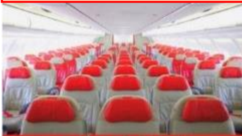
เครื่องบินลำใหญ่ 377 ที่นั่ง

ตัวเครื่องบินเป็นตัวกรู๊ปสำหรับคณะทัวร์ ระบบของสายการบินจะทำการแรนดอมที่นั่ง ซึ่งไม่สามารถล็อกหรือเลือกกระบุนั่งได้ หากลูกค้าต้องการเลือกกระบุนั่ง ทางสายการบินมีบริการอัพเกรดที่นั่ง (ค่าบริการเป็นไปตามที่สายการบินกำหนด)