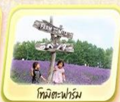
โทมิตะฟาร์ม