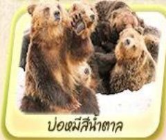
บ่อหมีสีน้ำตาล