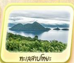
ทะเลสาบโทยะ