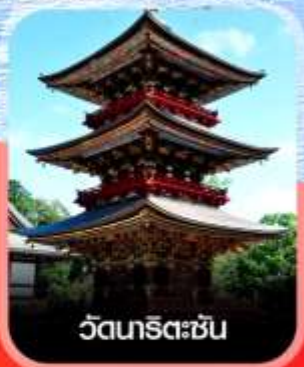
วัดเทริเดะซัน