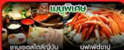
เมนูพิเศษ ซาชิมิสดรสญี่ปุ่น บุฟเฟ่ต์ญี่ปุ่น

โรงแรม ออนเซ็น อาหาร 9 มื้อ FREE! ฟรีWiFi เที่ยววัน ไม่มีค่าธรรมเนียม FREE! น้ำดื่ม