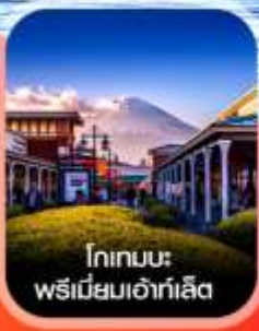
โทเทมะ พรีเมียมเอ้าท์เล็ต