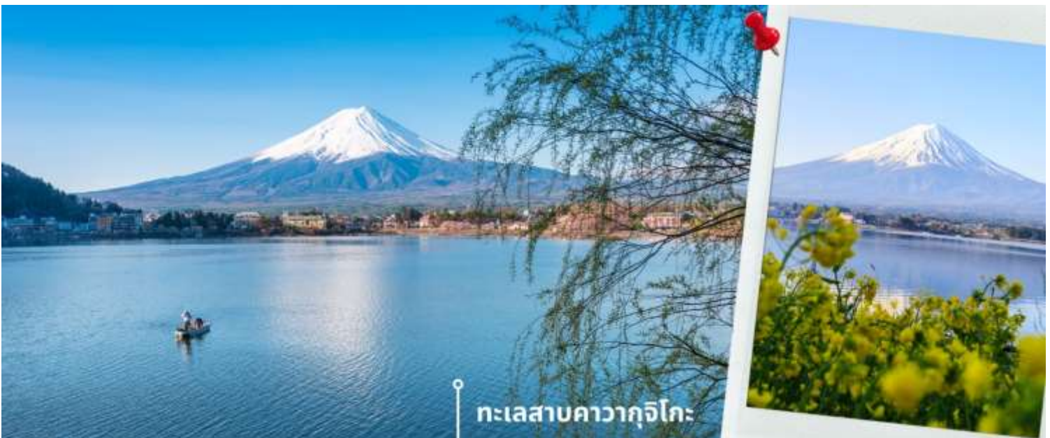
ทะเลสาบคาวากูจิโกะ

หลังรับประทานอาหารเช้า นำท่านแวะชม พิพิธภัณฑสถานแผ่นดินไหว เป็นพิพิธภัณฑสถานี่แสดงถึงผลกระทบจากภัยพิบัติแผ่นดินไหวและการระเบิดของภูเขาไฟ ภายในพิพิธภัณฑสถานี่มีห้องจัดแสดงข้อมูลการประทุของภูเขาไฟจากทุกมุมโลก โซนความรู้ต่างๆและโซนข้อปั้งสินค้าญี่ปุ่นอาทิเช่น ผลิตภัณฑ์เครื่องสำอางและของฝากอีกมากมาย พอสมควรแก่เวลานำท่านเดินทางสู่ ทะเลสาบคาวากูจิโกะ (Lake Kawaguchiko) ในจังหวัดยามานาชิ แหล่งท่องเที่ยวที่อยู่ไม่ไกลจากโตเกียว (Tokyo) หนึ่งในที่ที่เยวญี่ปุ่นยอดฮิตตลอดกาล ทะเลสาบที่กว้างใหญ่เป็นอันดับ 2 ของ 5 ทะเลสาบรอบภูเขาไฟฟูจิ อยู่บริเวณเชิงภูเขาไฟ ความสูงกว่าระดับน้ำทะเลประมาณ 800 เมตร ทำให้สภาพอากาศบริเวณนี้เย็นสบายตลอดปี รายล้อมไปด้วยธรรมชาติที่อุดมสมบูรณ์ และทิวทัศน์สวยงามตลอดปี ในช่วงเวลาที่พลาดไม่ได้เลยที่จะได้ชื่นชมดอกซากุระบาน คือในช่วงปลายเดือนมีนาคมจนถึงต้นเดือนเมษายน จะบานสะพรั่งสวยงามเรียงรายริมทะเลสาบ สามารถชมวิวดูทั้งทะเลสาบและภูเขาไฟฟูจิได้อย่างชัดเจน นับเป็นจุดชมซากุระยอดฮิตที่สุดอีกแห่งหนึ่งในญี่ปุ่น